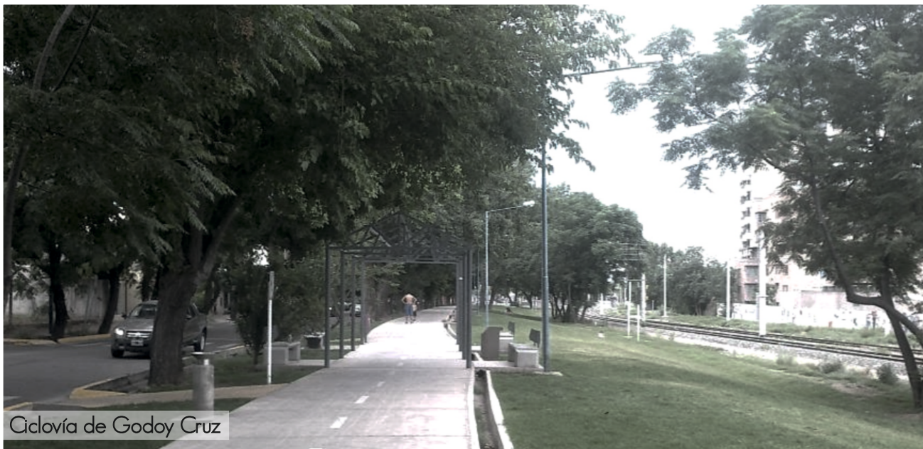
Ciclovía de Godoy Cruz