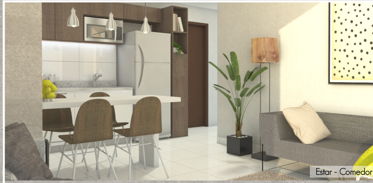
Estar - Comedor